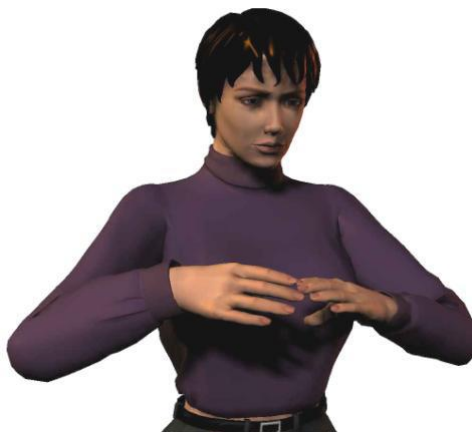
Optimale werkhogte voor knippen: tussen borst en schouderhoogte

De kapper verricht bij het werken aan de pompstoel de vaktechnische handelingen tussen borst en schouderhoogte met de schouders én ellebogen ontspannen laag hangend. Bij uitzondering mag de kapper hoger (tot ooghoogte) knippen.